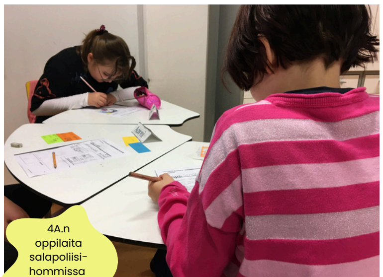
4.A:n oppilaita salapoliisihommissa

Megasanommiin saatiin myös joukko säätiedotuksia, määätiedotuksia, päätiedotuksia ja yksi jäätiedotus.